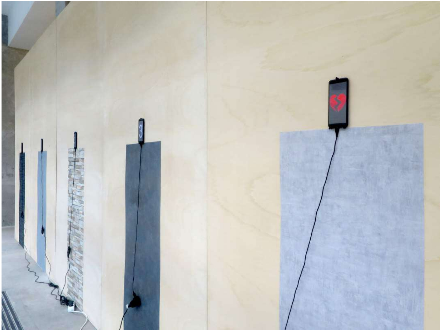
vue exposition Claude Closky, Direct messages | Salle Principale | du 16 mai au 20 juillet 2019

Direct messages | 2019 | installation | 5 smartphones, papiers peints, câbles et chargeurs électriques | Programmation Processing Jean-Noël Lafargue | 300 x 750 cm | durée illimitée