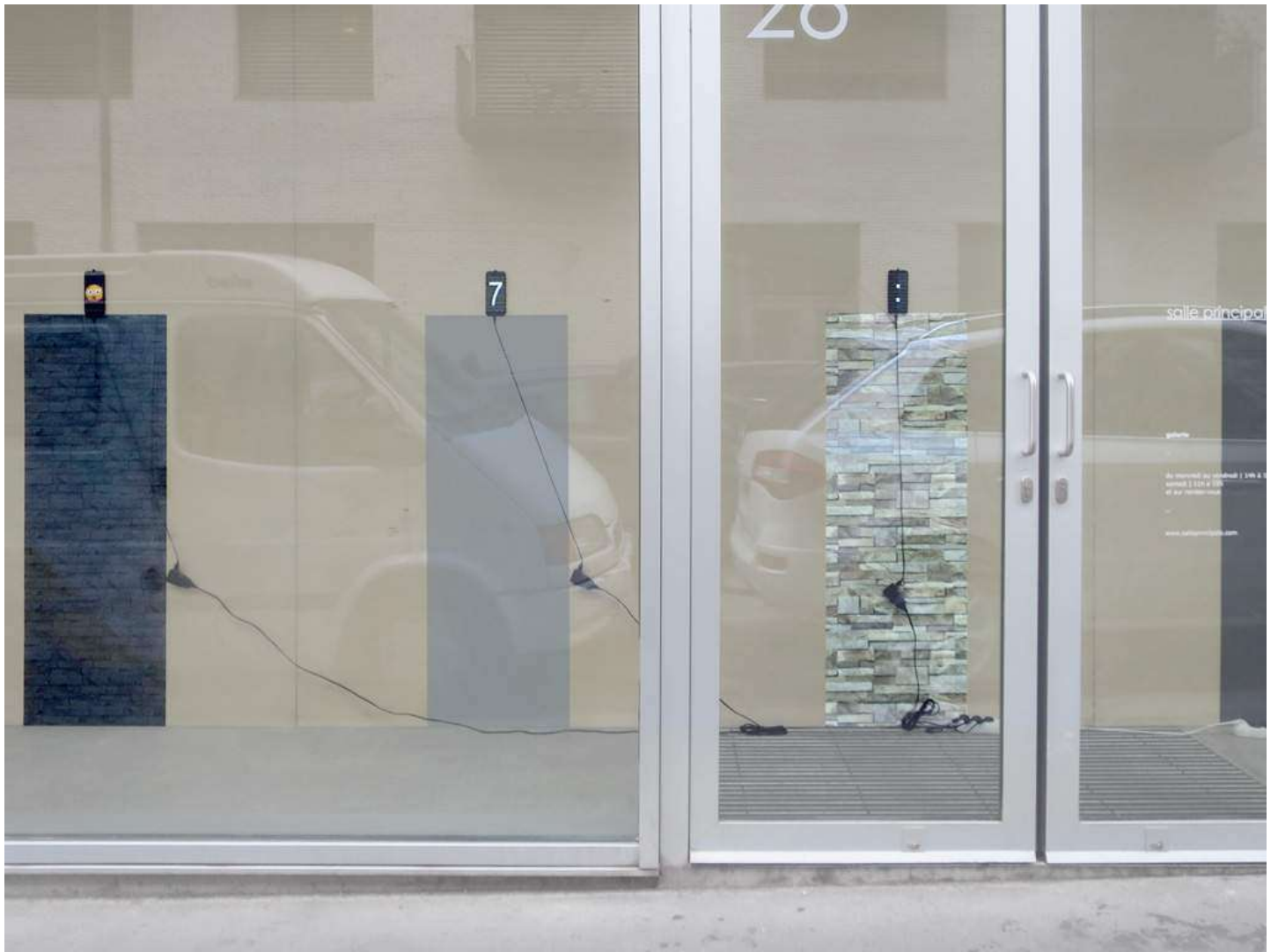
vue exposition Claude Closky, Direct messages | Salle Principale | du 16 mai au 20 juillet 2019

Direct messages | 2019 | installation | 5 smartphones, papiers peints, câbles et chargeurs électriques | Programmation Processing Jean-Noël Lafargue | 300 x 750 cm | durée illimitée