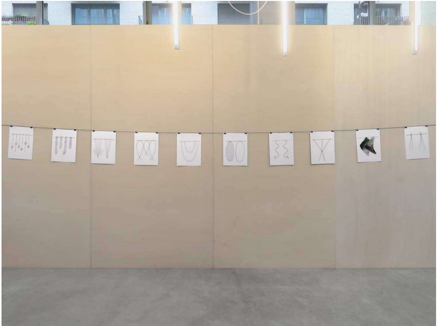
vue exposition Claude Closky, Direct messages | Salle Principale | du 16 mai au 20 juillet 2019

Suspendu | 2018-2019 | installation | corde noire (ø 0,3 cm), 10 dessins, stylo bille noir sur papier (40 x 30 cm chacun), pinces à dessin | 300 x 600 cm